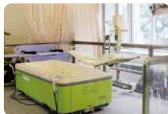
入浴実習室 福祉介護における実践的な実習が可能!