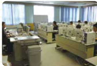
西パソコン室・東パソコン室 専門的な学習や各種資格取得を可能に!