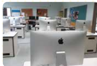
テクノアート室 iMacやiPadなどを取りそろえた施設!