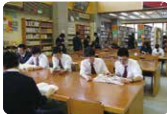
図書館 話題の本から定番の本まで蔵書が豊富!