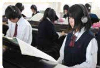
ピアノ室 校内にはなんと合計46台のピアノ!