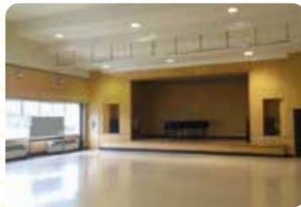
テクノホール 集会や各種発表会など、幅広く利用可能!