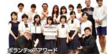
ボランティアアワード

大学から就職まで、進路希望に合わせて丁寧に指導します。福祉に関する資格を取得し、現場でも家庭でも役立つ介護技術を学ぶことができます。