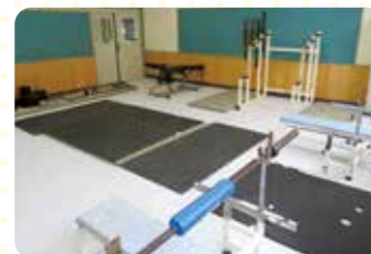
トレーニング室 武道場に加え新たに校舎内にも整備!