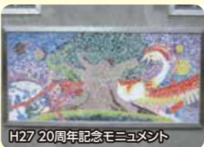
H27 20周年記念モニュメント