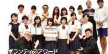
ボランティアアワード

大学から就職まで、進路希望に合わせて丁寧に指導します。福祉に関する資格を取得し、現場でも家庭でも役立つ介護技術を学ぶことができます。