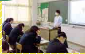
プロジェクターを使って分かりやすく説明!