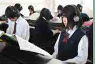
ピアノ室 校内にはなんと合計46台ものピアノ!