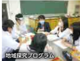
地域探究プログラム

国公立大学、私立大学、看護医療系専門学校など進路目標の実現のために、クラス一丸となって学習に取り組むことができる環境と体制を整えています。大学入試改革に合わせて探究活動を重視するとともに、進路目標達成に必要な科目に特化した学習ができます。