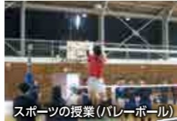
スポーツの授業(バレーボール)

授業と部活動を運動させ、効果的に部活動の種目の競技力向上を図ります。ICTを活用したり、トレーニングや生涯スポーツも学ぶことができます。