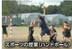
スポーツの授業(ハンドボール)