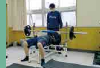
トレーニング室 武道場やハウスに加え校舎内にも整備!