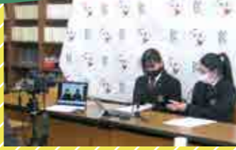
学校行事にも積極的にICTを活用!!