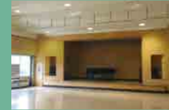
テクノホール 集会や各種発表会など、幅広く利用可能!