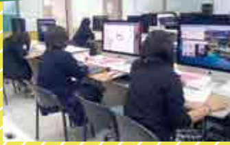
Macやペンタブでデジタル作品を制作!