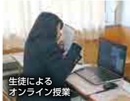
生徒による オンライン授業