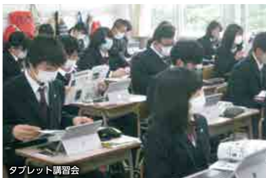
タブレット講習会