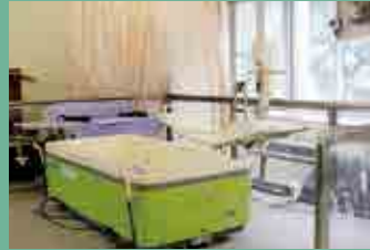
入浴実習室 福祉介護における実践的な実習が可能!