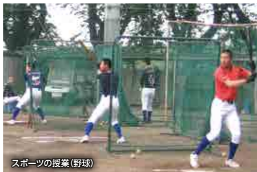
スポーツの授業(野球)