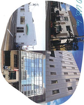
Worldwide Technicians group